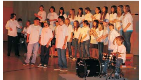
Zu Beginn gab es im Turnsaal einen ansprechenden Festakt.

Die Mittelschule Schruns-Grüt präsentierte ihre Schule mit einem ansprechenden Festprogramm.