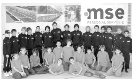
Freuten sich über die neuen Trainingsanzüge: SchülerInnen der HS Grüt.